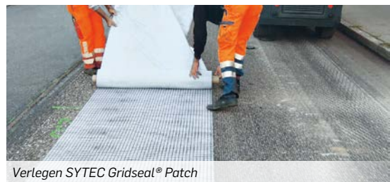
Verlegen SYTEC Gridseal® Patch