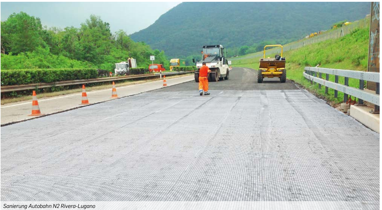
Sanierung Autobahn N2 Rivera-Lugano