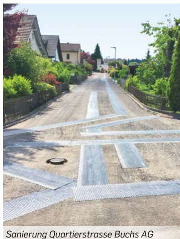
Sanierung Quartierstrasse Buchs AG