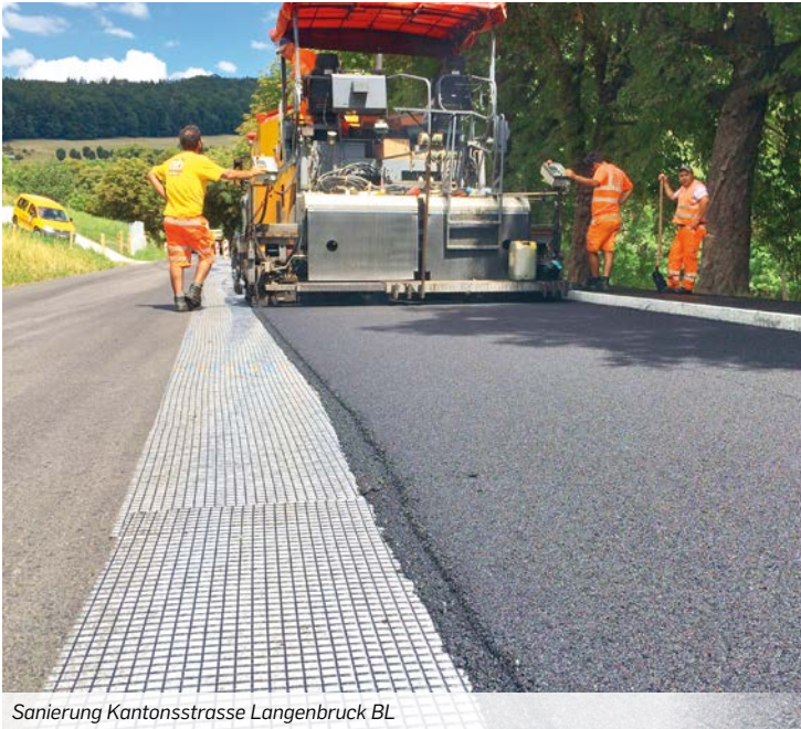
Sanierung Kantonsstrasse Langenbruck BL