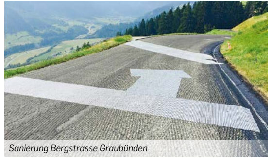
Sanierung Bergstrasse Graubünden