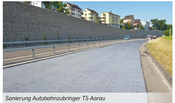
Sanierung Autobahnezubringer T5 Aarau