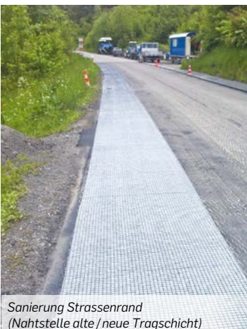
Sanierung Strassenrand (Nahtstelle alte / neue Tragschicht)